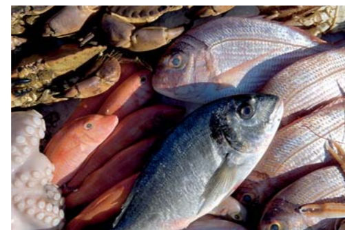
Spezialitäten aus allen Weltmeeren kommen frisch auf den Markt

Bis vor wenigen Jahren stand noch die auf das Jahr 1886 zurückgehende traditionelle Fisch-Auktion im Zentrum der Handelsaktivitäten. Heute werden die Warenströme in geschlossenen Kühlketten zwischen den Fanggebieten und dem Hamburger Elbufer per Truck oder Luftfracht zunehmend „online“ bewegt. Früher wie heute ist Hamburg einer der bedeutendsten deutschen Märkte für Frischfisch und Seafood.