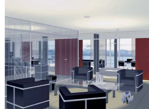
Transparent und edel: Planung für ein Büro in einem Umbauprojekt

Die systematische Entwicklung und Aufwertung des vorhandenen Immobilienbestandes sowie Investitionen in hochwertige und stilvolle Umbauten kennzeichnen das Niveau unseres Engagements. Das Elbkaihaus und die denkmalgeschützte Halle D sind unübersehbare architektonische Zeichen dieses dynamischen Wandels.