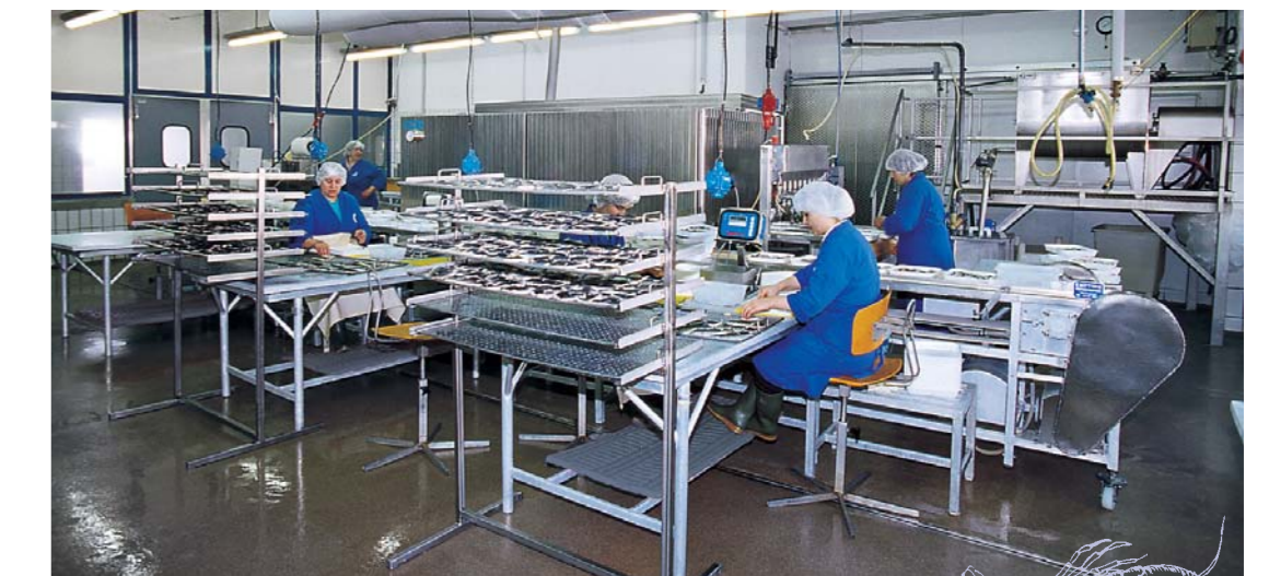
Mit modernem Maschinenpark werden hochwertige Rohstoffe handwerklich zu edlen Spezialitäten verarbeitet