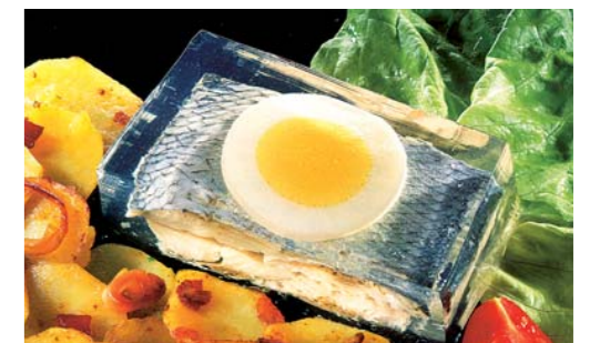
Arbeit von Spezialisten für Gourmets: qualifizierte Mitarbeiter garantieren optimale Qualität