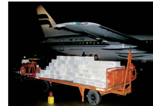
Hochwertige und empfindliche Spezialitäten werden zunehmend per Luftfracht transportiert