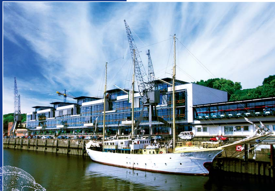
Maritimes Ambiente ist am Elbkaihaus kein Fremdwort

Werbeagenturen, Kanzleien, Verlage oder Redaktionen lassen sich neben traditionellen Fischhandelshäusern nieder. Helle und repräsentative Räume mit Blick auf Elbe und Hafen sind ideal für Dienstleister, die sich, genauso wie ihren Kunden und Besuchern, etwas Besonderes bieten wollen.