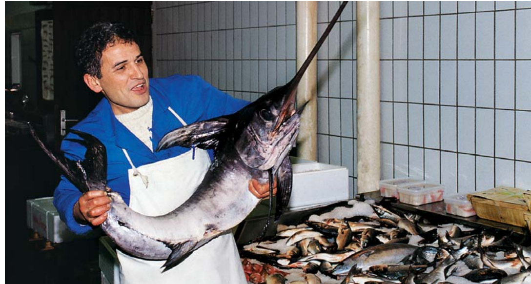
Mit Leidenschaft für frischen Fisch und Seafood

Die Fischmarkt Hamburg-Altona GmbH vermittelt zwischen den internationalen Lieferanten und den regionalen Kunden aus Großhandel und Produktion. Als integriertes Modul weltweiter Logistik bieten wir die vom Markt verlangte Premium-Qualität zu attraktiven Konditionen auch in kleineren Chargen. Groß- und Einzelhändler, Gastronomen und Einkäufer finden hier täglich ihren Markt. Die unmittelbare Nähe zu frischem Fisch und Meeresfrüchten aus aller Welt und das unverwechselbare Ambiente locken aber auch anspruchsvolle Privatkunden an die Große Elbstraße.