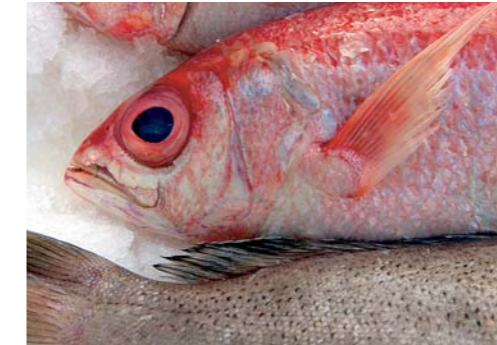
Jeden Morgen fangfrisch: Edelfische in der Markthalle

An der Schnittstelle zwischen Groß- und Einzelhandel und in unmittelbarer Nähe zur A7 erhalten Sie vom Kühlhaus bis zum Zoll-Lager, von der Produktion bis zur Veredelung, von der Frostung bis zur Etikettierung den kompletten Service aus einer Hand.