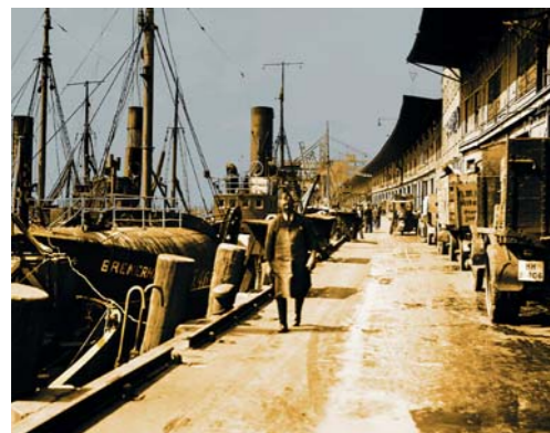
Moderne mit Tradition – der Fischmarkt um 1930

Die Fischmarkt Hamburg-Altona GmbH vermittelt zwischen den internationalen Lieferanten und den regionalen Kunden aus Großhandel und Produktion. Als integriertes Modul weltweiter Logistik bieten wir die vom Markt verlangte Premium-Qualität zu attraktiven Konditionen auch in kleineren Chargen. Groß- und Einzelhändler, Gastronomen und Einkäufer finden hier täglich ihren Markt. Die unmittelbare Nähe zu frischem Fisch und Meeresfrüchten aus aller Welt und das unverwechselbare Ambiente locken aber auch anspruchsvolle Privatkunden an die Große Elbstraße.